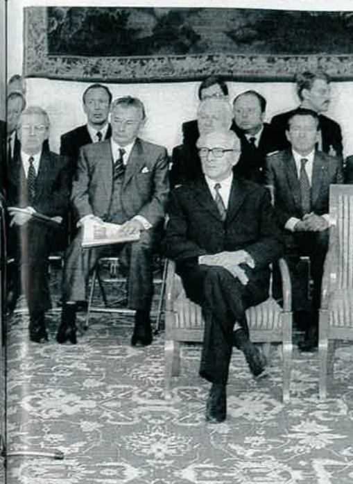
1987 auf Teppich aus Göring-Nachlass, Teppich heute: Niemand kann die Auslegeware gebrauchen, keiner traut sich, sie zu verkaufen