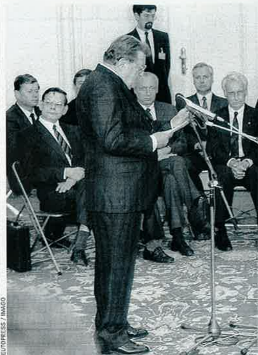
Ministerpräsident Strauß mit Besucher Honecker