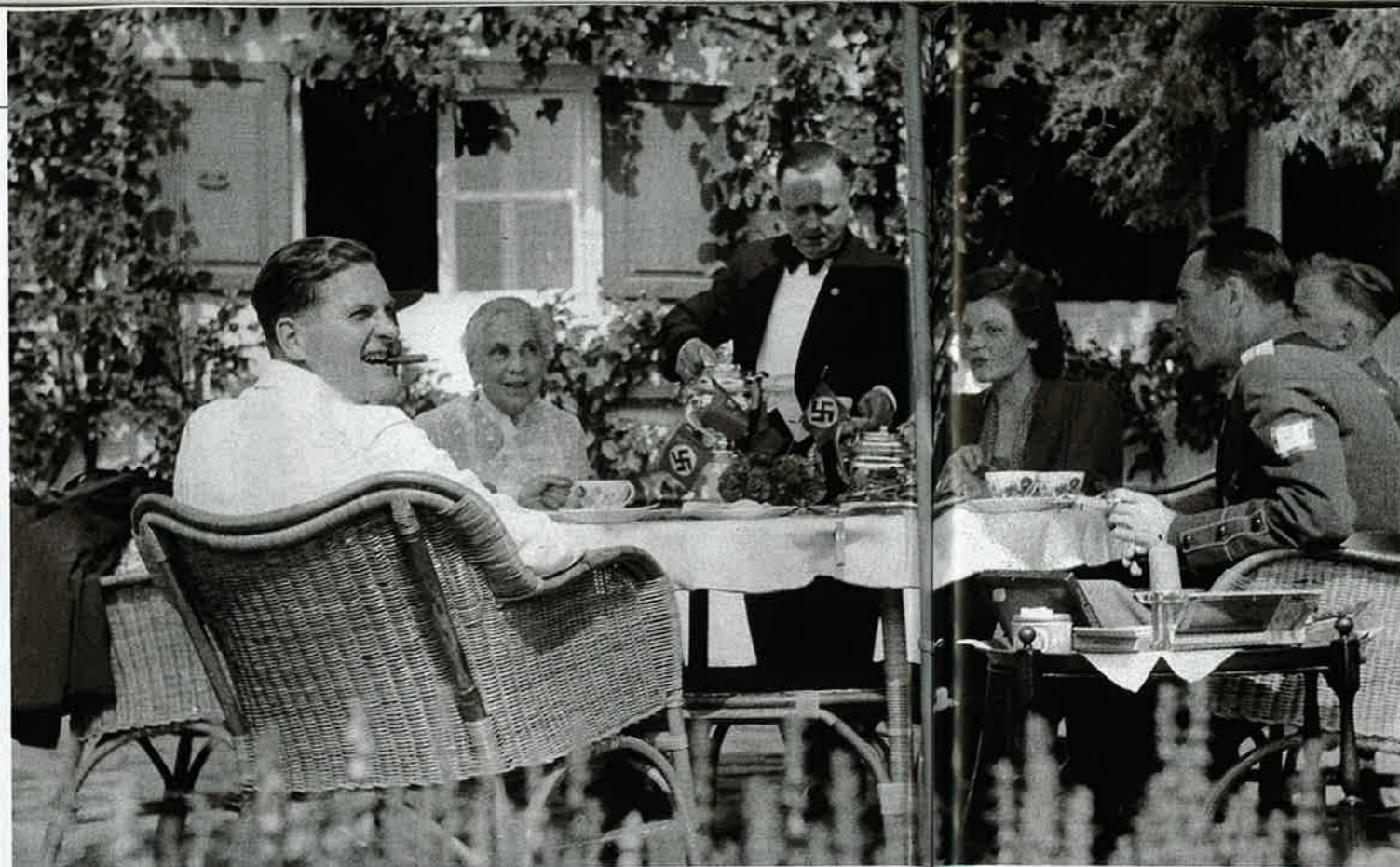
Gastgeber Schirach (l.) 1938 in seinem Landhaus in Kochel am See: 100 Prozent Gewinn in nur

So kann man sich irren. Keineswegs waren die Provenienzen gründlich erforscht. Teilweise sind sie bis heute nicht zu klären: bei der Verdure in Bonn etwa, beim Schreibmöbel des Bundespräsidenten und der Canaletto-Kopie in der Parlamentarischen Gesellschaft.