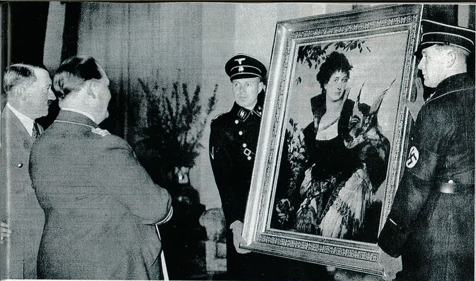
Schenker Hitler, Empfänger Göring 1938 mit Gemälde „Die Falknerin“ von Hans Makart: „Voller Glück und Stolz“

Damit ist gewiss: Ohne zusätzliches Geld und ohne politischen Willen wird das vorerst letzte Kapitel der Wiedergutmachung durch die Bundesrepublik kein würdiges Ende finden. Restitution ist eigentlich die Wiederherstellung eines früheren Rechtszustands. Was die Rückgabe der Kunstwerke angeht, klagt die jüdische Opferorganisation Jewish Claims Confe-