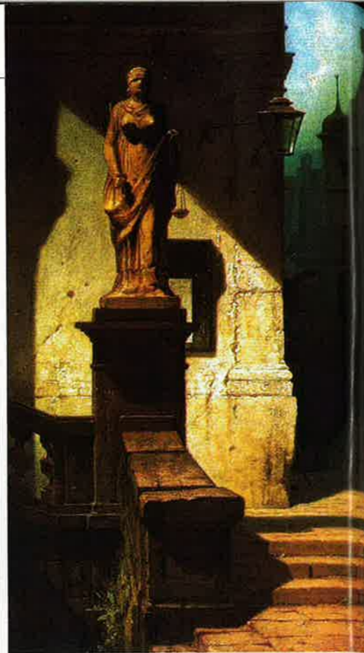
Spitzweg-Gemälde „Fiat Justitia“ „Unvermindert zähe Verhandlungen“