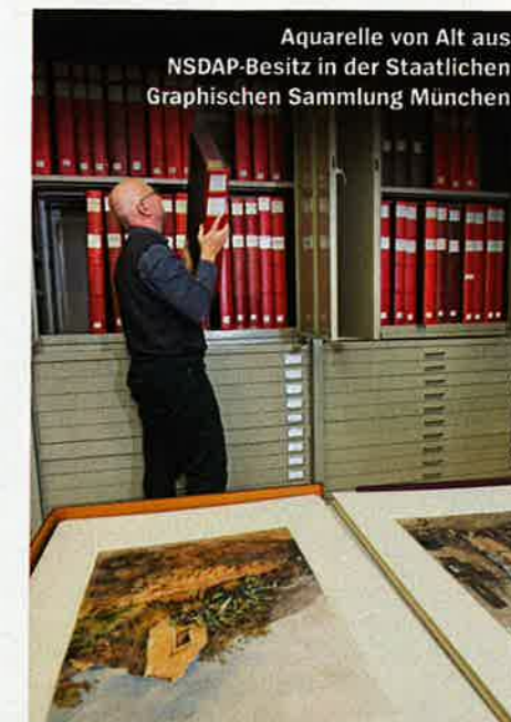
Aquarelle von Alt aus NSDAP-Besitz in der Staatlichen Graphischen Sammlung München